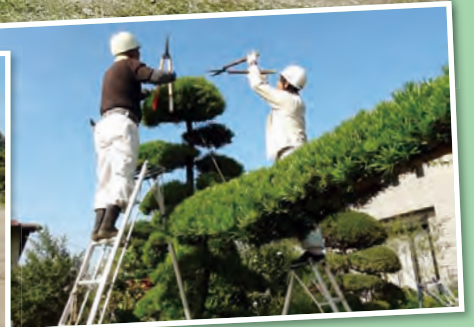
表紙／会員の活動風景