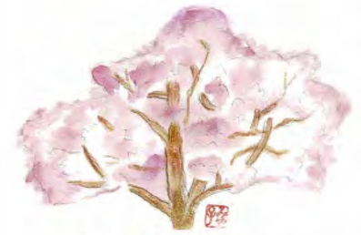
さくら 花言葉：優雅な女性

公益社団法人 宮代町シルバー人材センター 埼玉県南埼玉郡宮代町山崎3番地 TEL0480-37-1353 FAX0480-37-1951 e-mail miyashiro-sjc@rondo.ocn.ne.jp 会員数174名(男124・女50名)