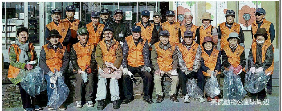
東武動物公園駅周辺