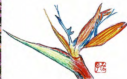
ストレリチア 花言葉：氣どった恋