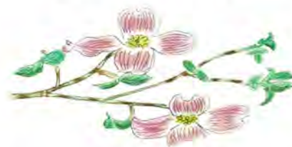
ハナミズキ 花言葉：華やかな恋

公益社団法人 宮代町シルバー人材センター 埼玉県南埼玉郡宮代町山崎3番地 TEL0480-37-1353 FAX0480-37-1951 e-mail miyashiro-sjc@rondo.ocn.ne.jp 会員数 185名(男135、女50)