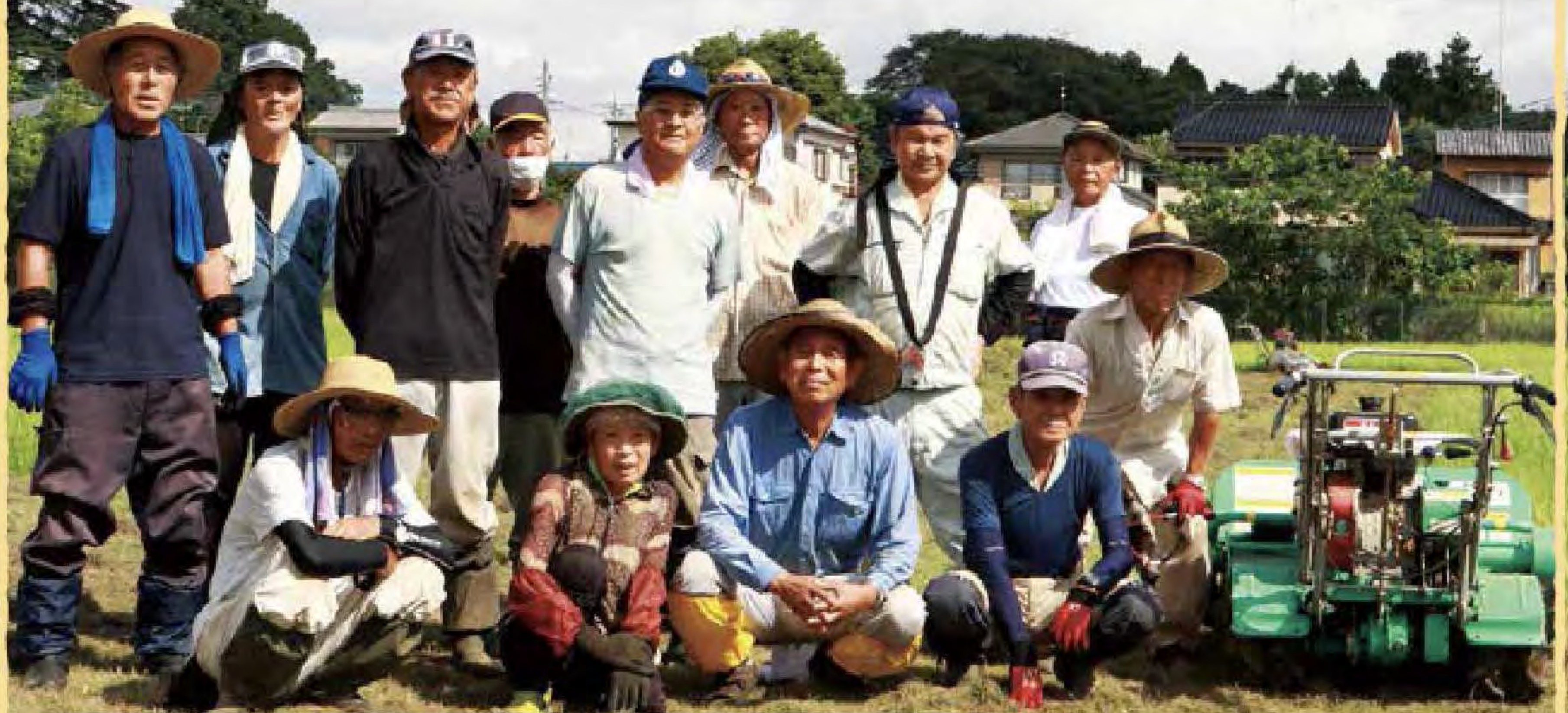
時は午前9時。東グラウンドの草刈り作業にあたるシルバー会員のみなさん。 9月上旬は町内各所から草刈りの依頼があり、多い時には週6日活動する時もあったそうです。 「熱中症に負けないように、今日も頑張るよ！」と青空の下、汗と笑顔が輝いていました。