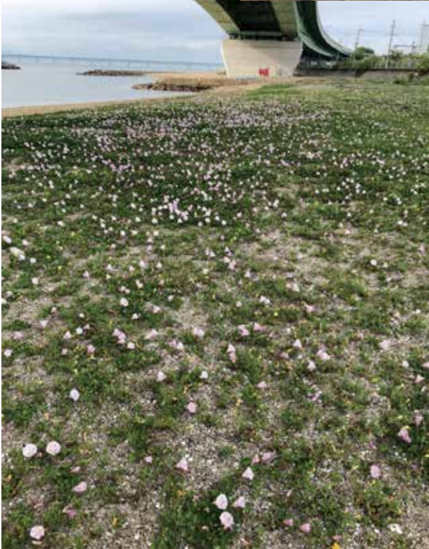
6日間(延42人)の作業で綺麗な浜辺になりました