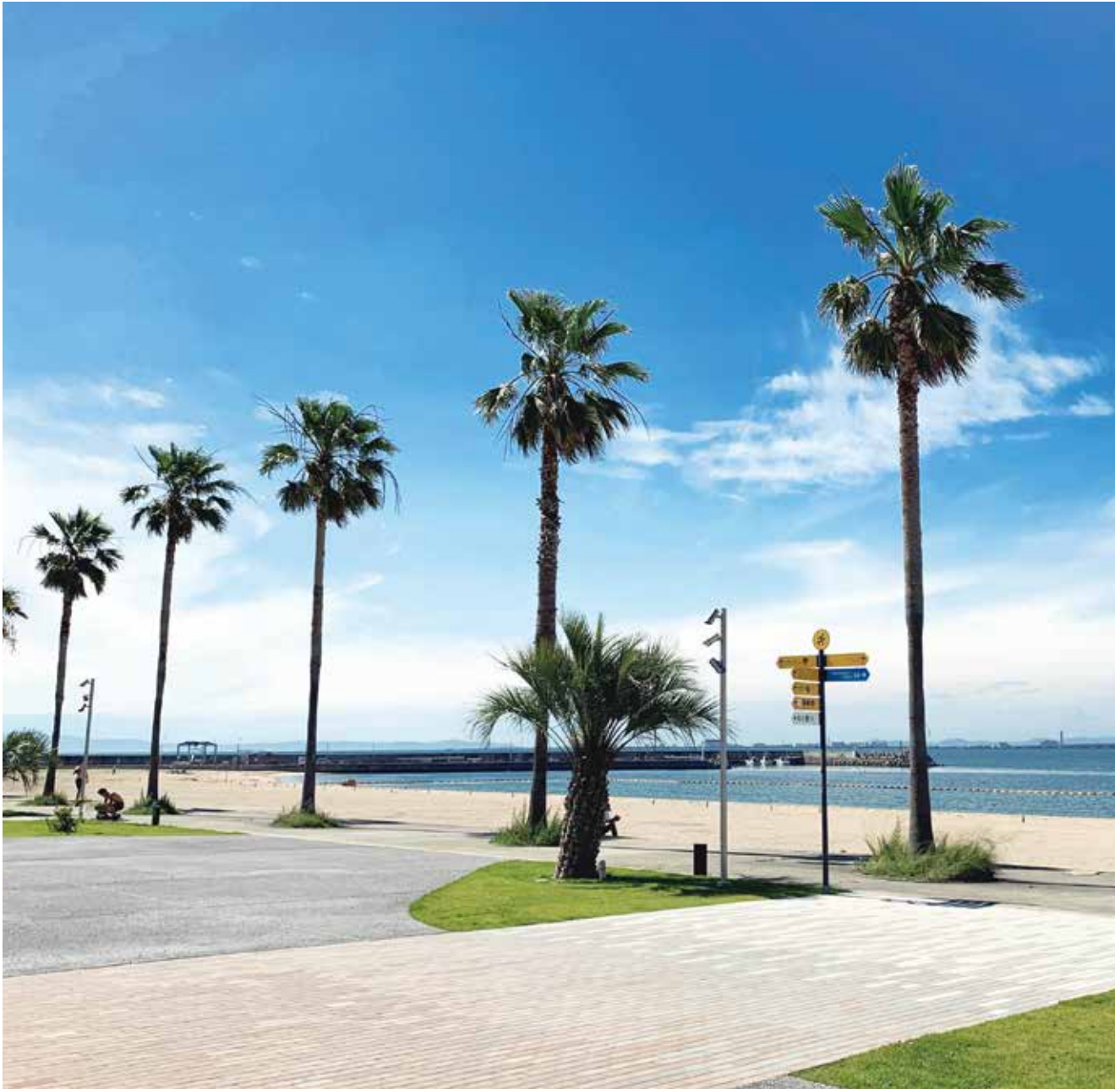
タリイサザンビーチ

泉南市シルバー人材センター 泉南市信達市場1584番地の4 電話 (072)483-8661