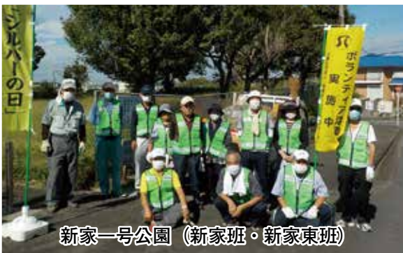
新家一号公園 (新家班・新家東班)

収集されたゴミは、軽トラックで運ばれて、公園も、私の気持ちも、とてもすっきりした、ボランティア活動の日