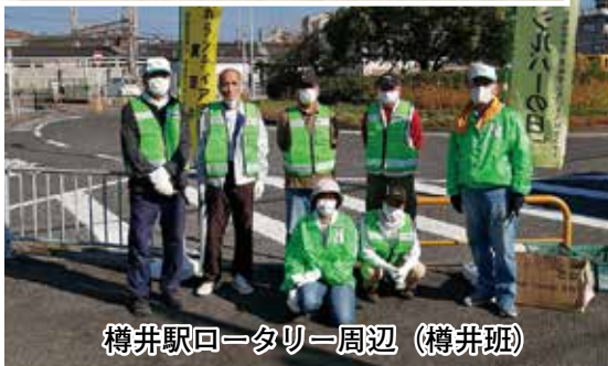
樽井駅回一タリ一周辺 (樽井班)