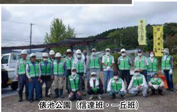
俵池公園 (信達班・一丘班)