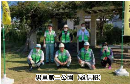
男里第二公園 (雄信班)