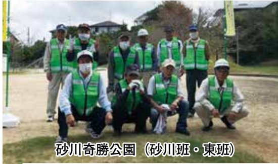
砂川奇勝公園 (砂川班・東班)