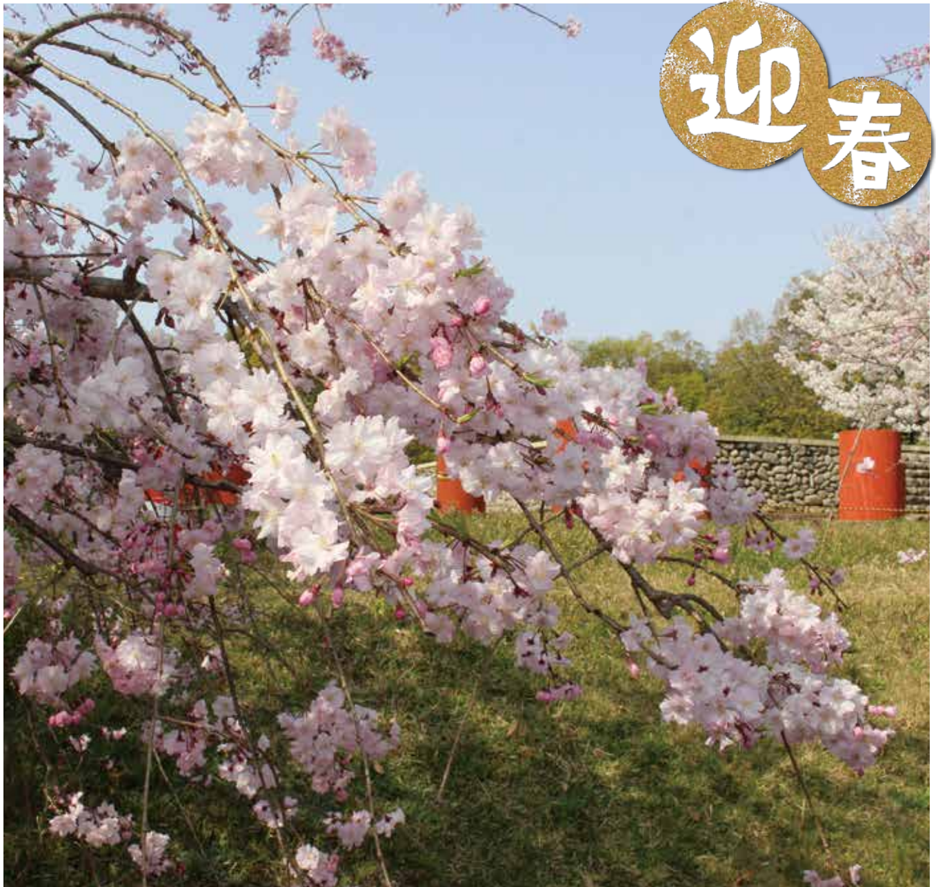
国史跡 海会寺跡広場の桜

泉南市シルバー人材センター 泉南市信達市場1584番地の4 電話 (072)483-8661