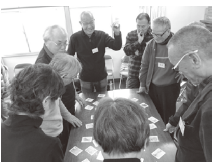
せんなんかるた取り