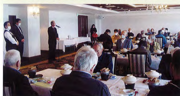
親睦日帰り旅行(若狭小浜)