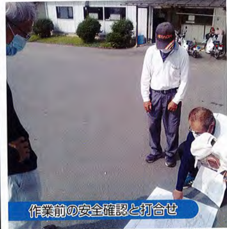
作業前の安全確認と打合せ