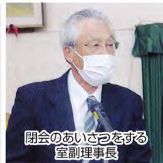
閉会のあいさつをする室副理事長