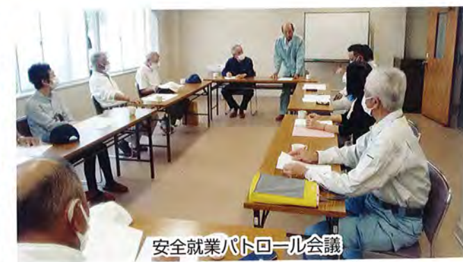
安全就業パトロール会議