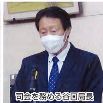
司会を務める谷回局長