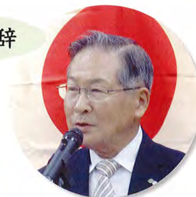
京丹波町町長 畠中 源一様