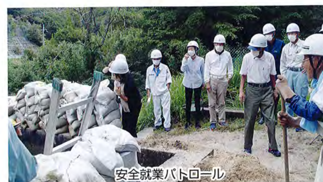
安全就業パトロール