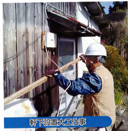
軒下設置大工仕事