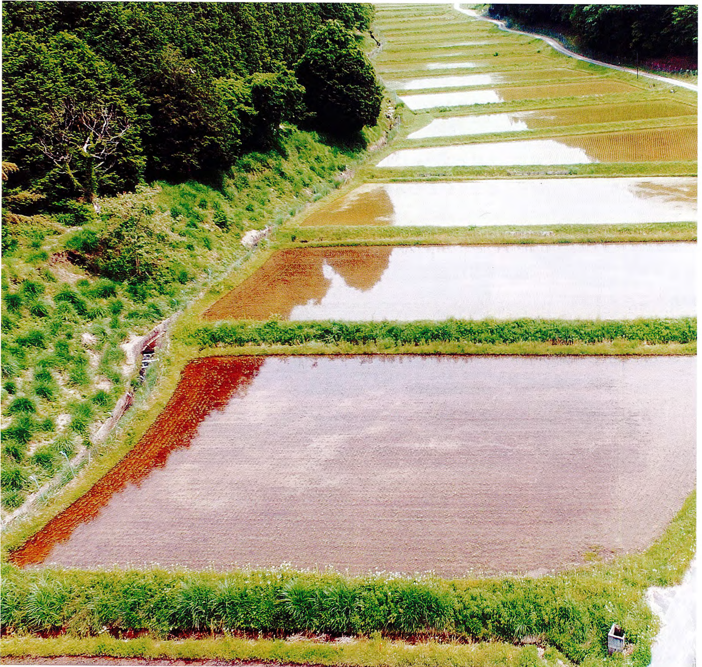
（瑞穂の水田水鏡）