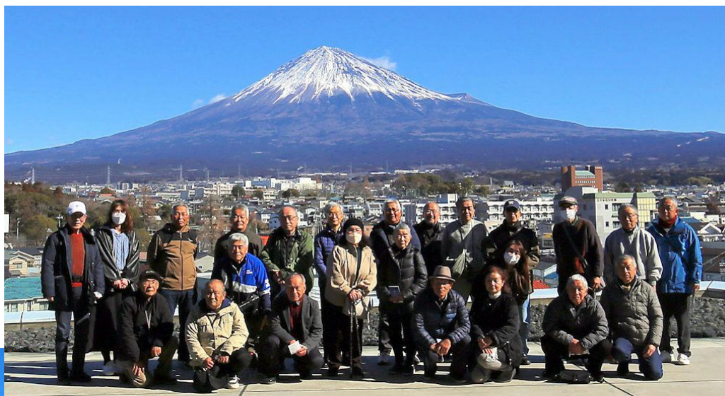
視察研修会 富士山 世界遺産センター 2月19日