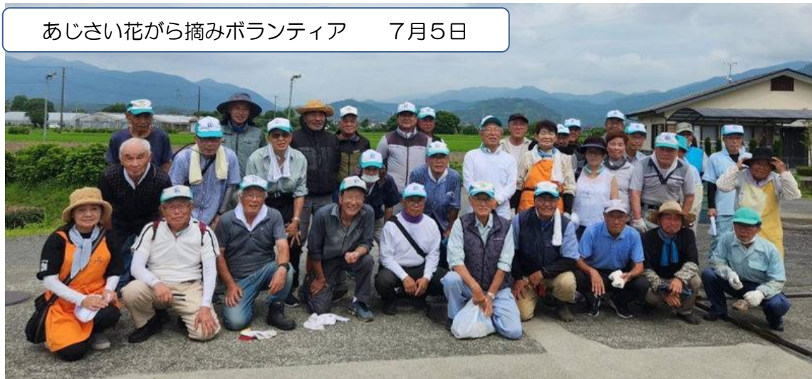
あじさい花から摘みボランティア 7月5日