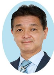
開成町長 山神 裕