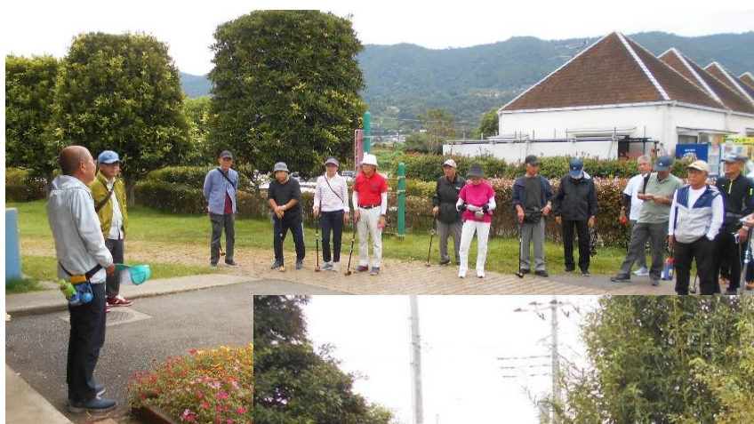
パークゴルフ大会 町パークゴルフ場 10月4日