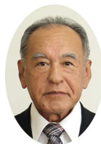
(公社) 開成町シルバー人材センター