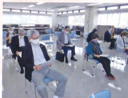
総会風景(ソーシャルディスタンス)