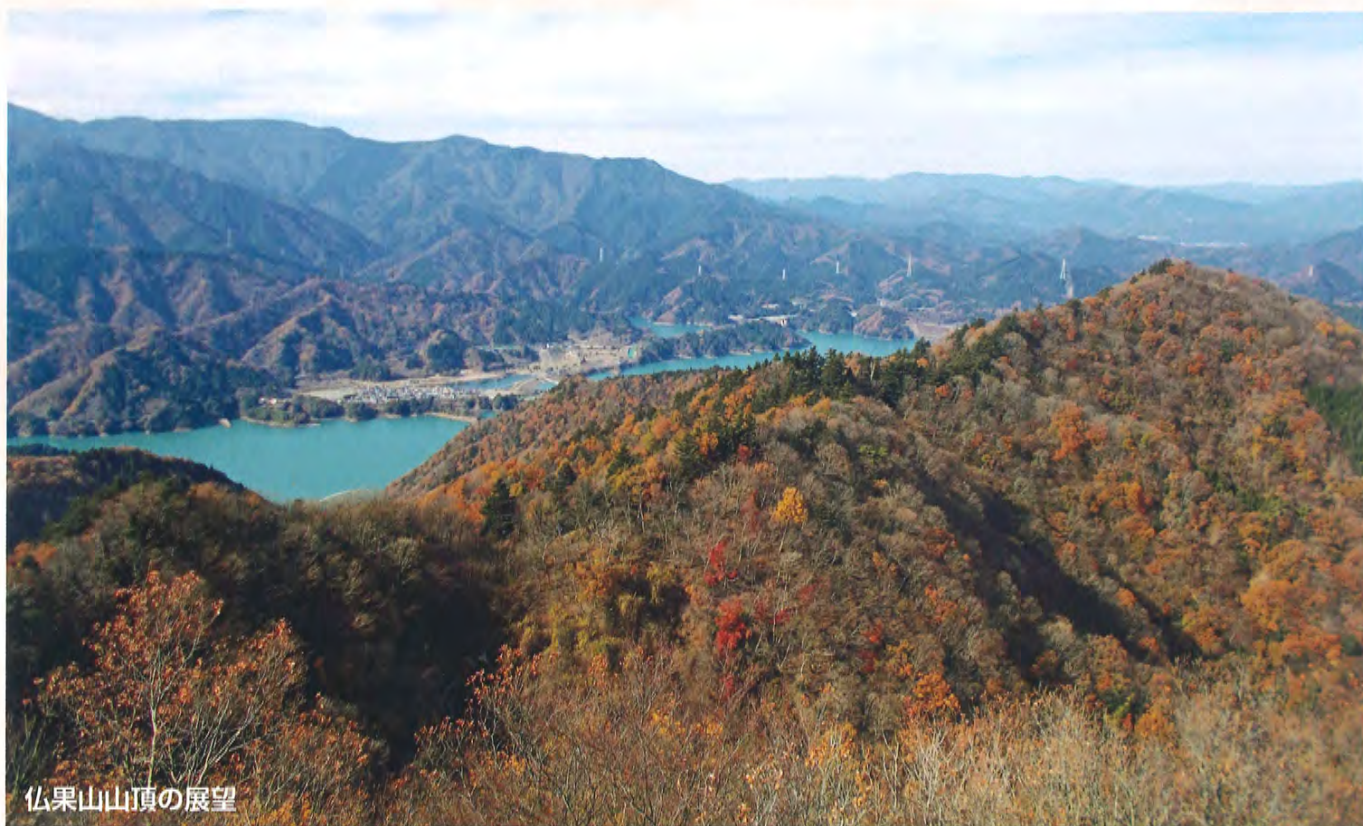
仏果山山頂の展望