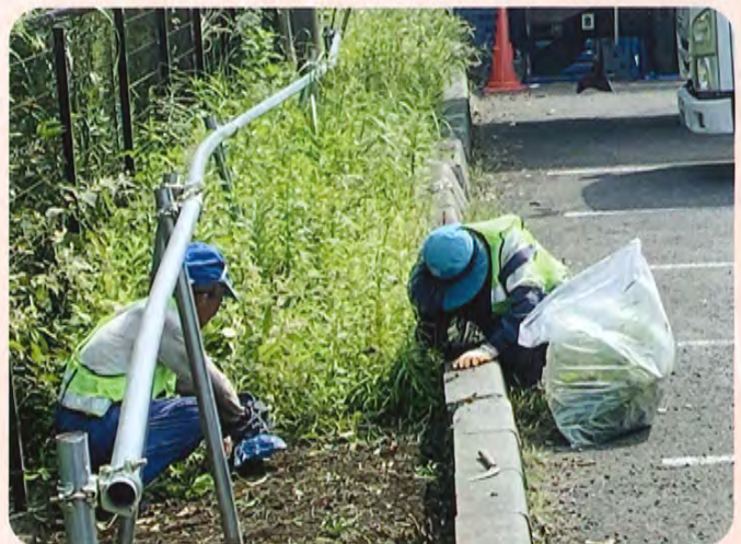
物流センター内 除草