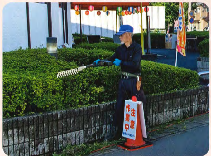
遊戯施設 樹木剪定