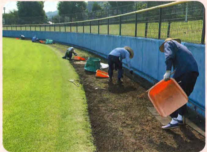
公共施設 球場除草

お客様から感謝されるような丁寧なお仕事を目指し、また、働く事への感謝の気持ちを忘れずに日々、活動しています。