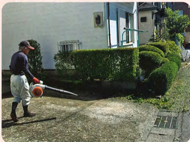
個人宅 剪定後の清掃