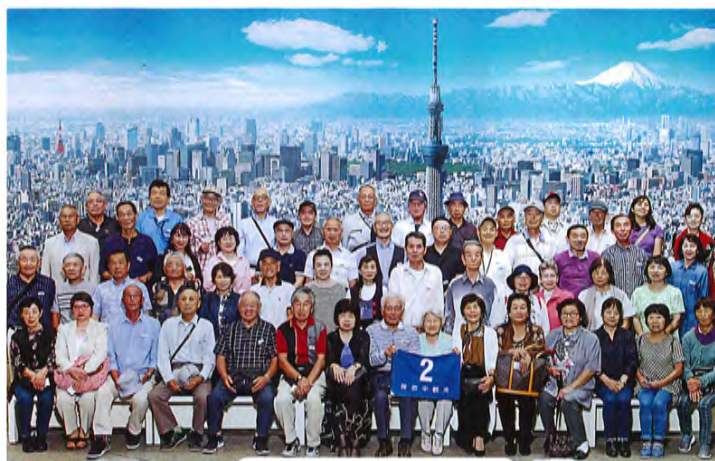
東京スカイツリー