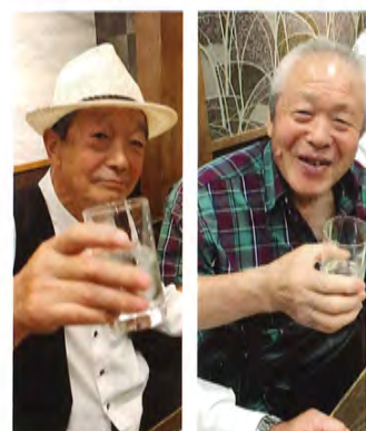
両国八百八町 花の舞 江戸東京博物館前店