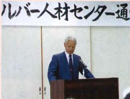
大竹副理事長(閉会)