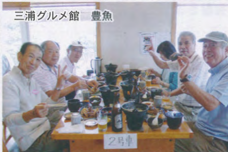
三浦グルメ館 豊魚