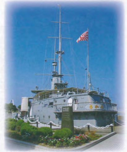
記念艦 三笠 (撮影：柴田)

本年度は、三浦半島・横須賀方面に行ってきました。 はじめに城ヶ島に行きましたが、ここへは東京に上京した昭和三十七年に行って以来、半世紀ぶりに訪れました。いざ行くと当時と変わらない景色がそこにあり感激しました。