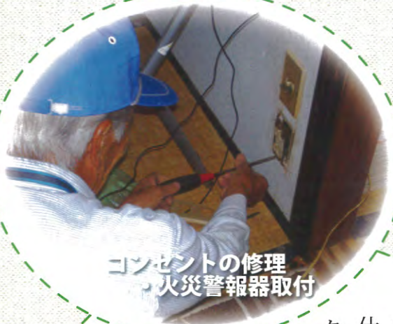
コンセントの修理 火災警報器取付