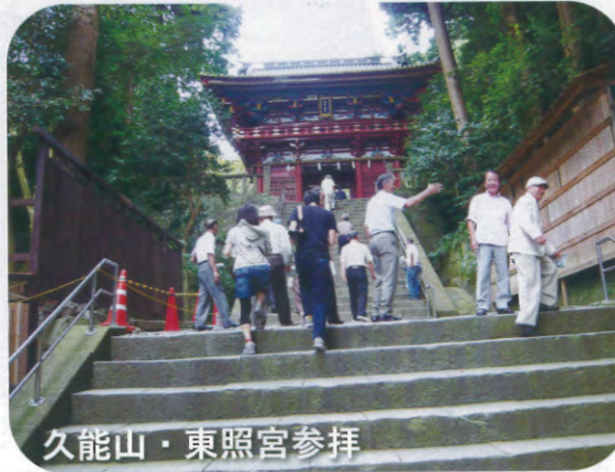
久能山・東照宮参拝