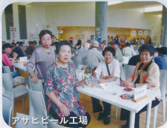
アサヒビール工場