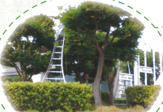
植木の剪定 (文化会館)