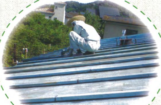
屋根のペンキ塗り