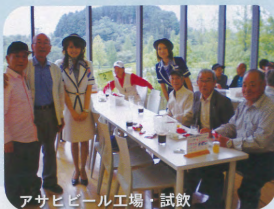
アサヒビール工場・試飲