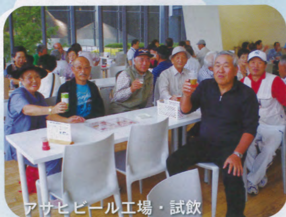
アサヒビール工場・試飲