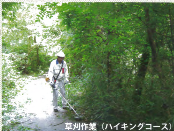
草刈作業 (ハイキングコース)