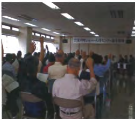
出席申込者144名の通常総会