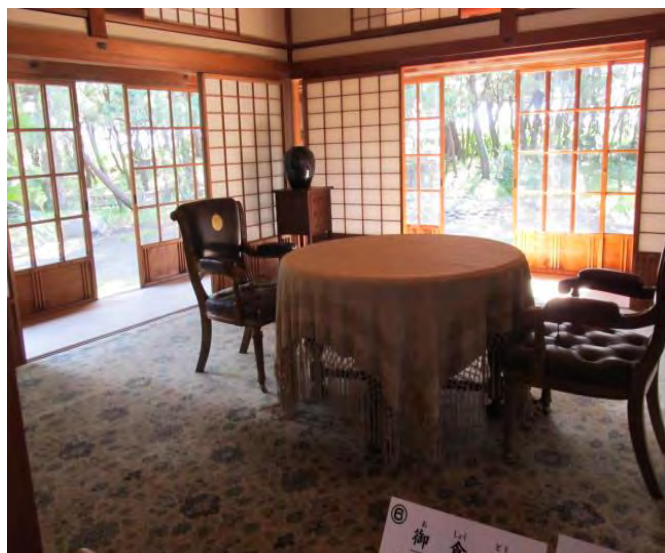
ここで、何を話したのかな？