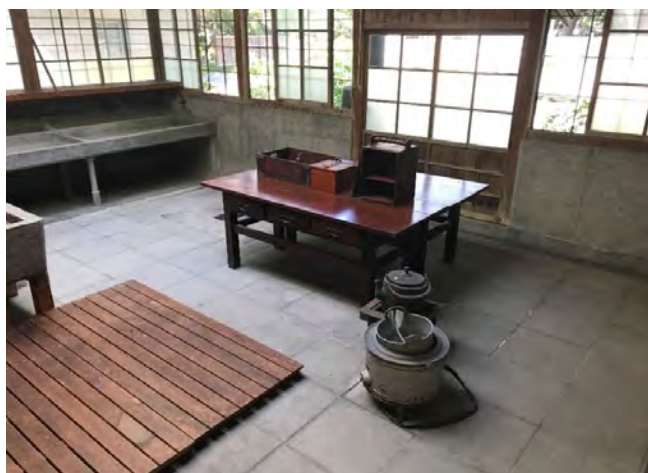
台所です。今風に言うと、キッチン。