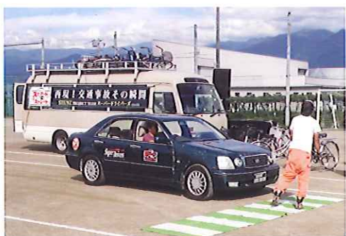
交通安全教室風景

交通安全意識の高揚を図るため、「シニア・ジュニア交通安全教室」が平成二十八年九月二十七日に、一宮中学校校庭等で開催され、全校生徒三百名、シルバー会員三十名をはじめ約四百名が参加しました。歩行時における危険体験・反射材の効果実験の後、プロのスタントマンによる交通事故の模擬演技が行われ、交通事故の怖さを体感しました。