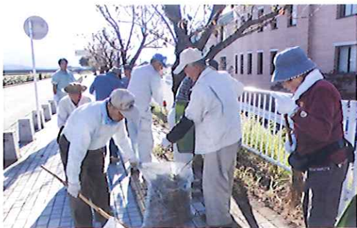
ボランティア活動風景

また、平成二十八年四月三日の第十二回桃の里マラソン大会に、百九名の会員がコース案内のお手伝いをしました。