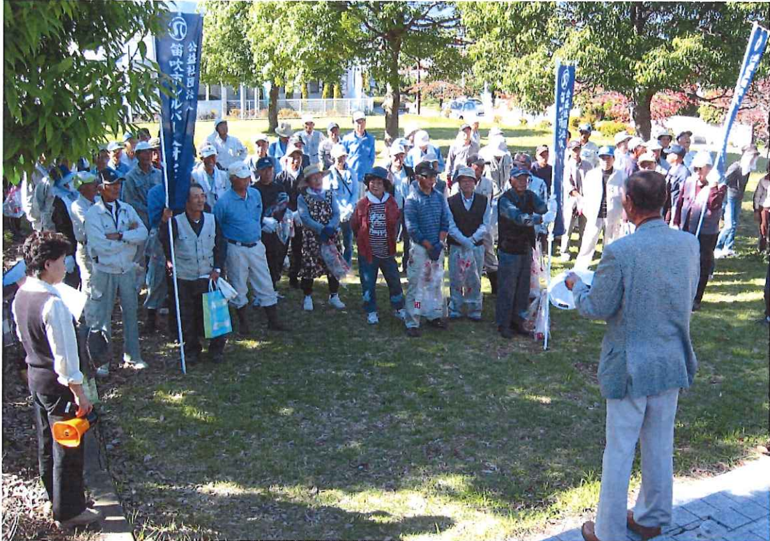
(ボランティア清掃作業前の打ち合わせ 一宮町にて)

平成 25 年 5 月 28 日発行 公益社団法人 笛吹市シルバー人材センター 〒405-0073 笛吹市一宮町末木 807-6 TEL: 0553-39-8300