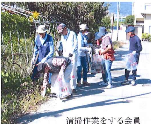
清掃作業をする会員

これらのボランティア活動は、会員自身の心身のリフレッシュや、地域貢献にもつながり、年々参加者が増えています。