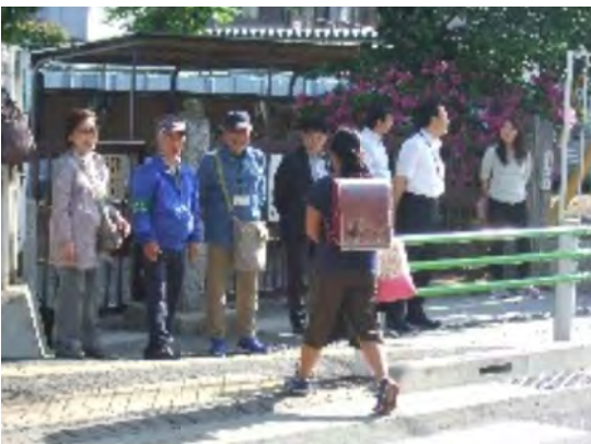
潤徳小で笑顔のあいさつ(左3人が会員)