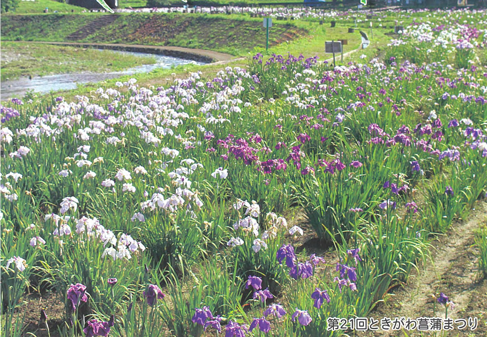
第21回ときがわ菖蒲まつり