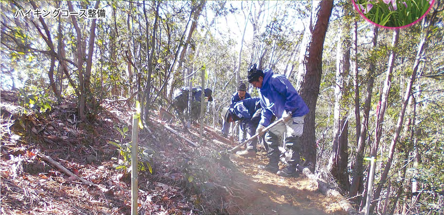
ハイキングコース整備