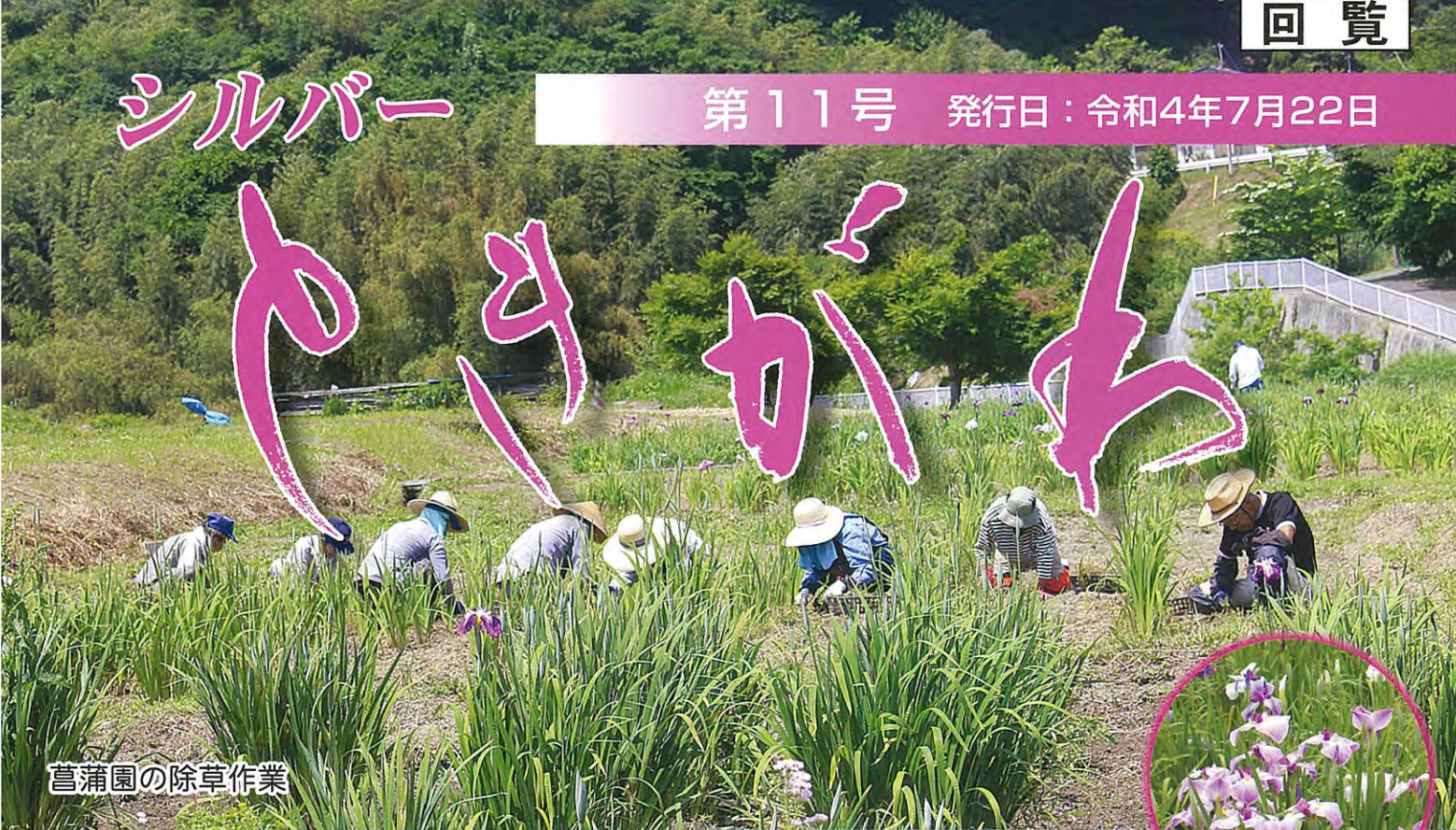
菖蒲園の除草作業