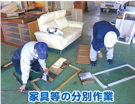
家具等の分別作業

空き家などの片付けや不用 となった家具など、解体・分 別作業を行なって、小川地区 衛生組合に搬入して、処分を しております。