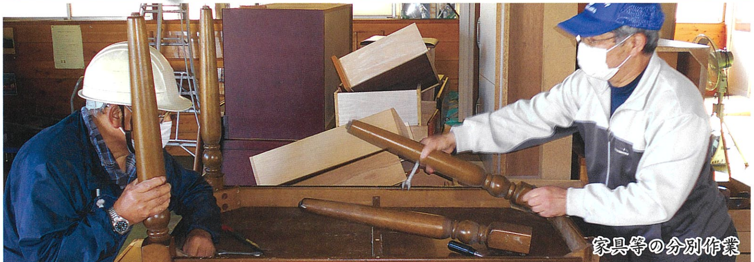
家具等の分別作業