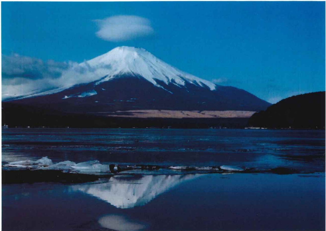
富士山を撮り続けて20年。初めて二重雲が取れました。