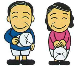
いさいさん はつらつさん

企業や事業所の清掃や軽作業から、ご家庭内のちよつ とした仕事など様々な仕事をお引受けしています。