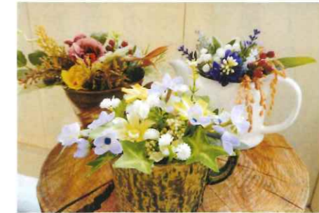
① 大澤 良江 ② アレンジフラワー ③ 工芸