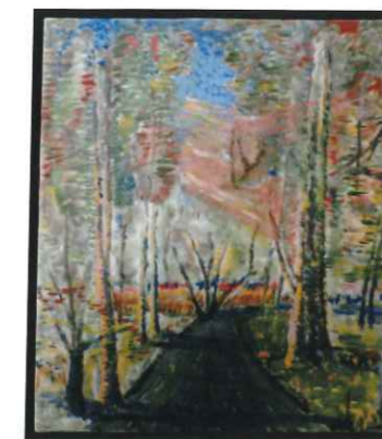
① 房 利一 ② 嵐山の小道 ③ 油彩(F10)