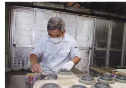
製品の仕上げ作業