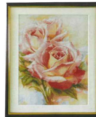
① 片桐 真弓 ② 薔薇 ③ クロスステッチ刺繍 (37cm×45cm)