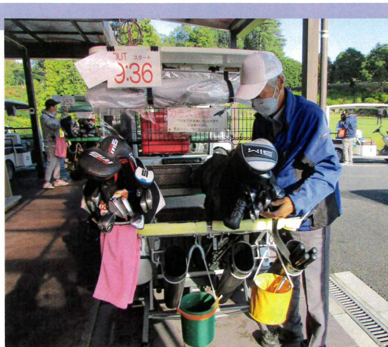
ゴルフバックの積み降ろし作業