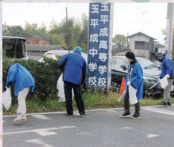
埼玉平成高校方面