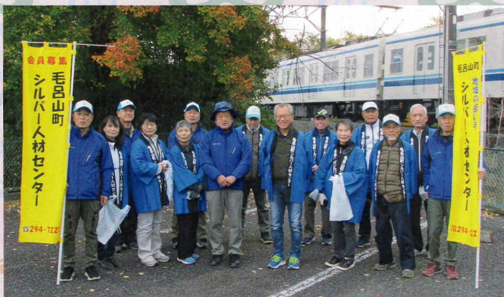
川角駅周辺の清掃活動