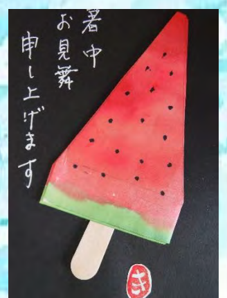
絵手紙同好会の皆さんによる作品