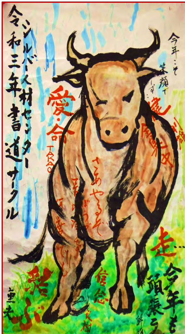
書道同好会の皆さんによる作品