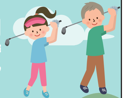
霞ヶ浦国際ゴルフコースにて