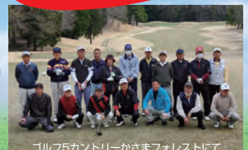
ゴルフ5カントリーかさまフォレストにて